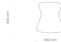
fungo Hocker FU 9000, Sitzhöhe 460 mm