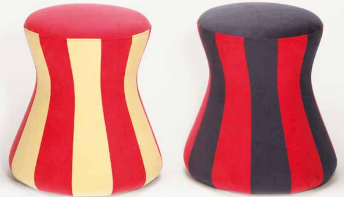
: fungo FU 9000, Mikrofaser

/ durch Gestaltung und Materialzusammensetzung garantiert fungo Freude am „bewegten Sitzen“ im Arbeits- und Wohnbereich.