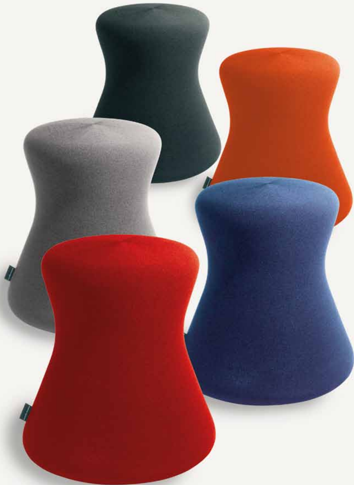
: fungo FU 9000, Strickbezug verschiedene Farben